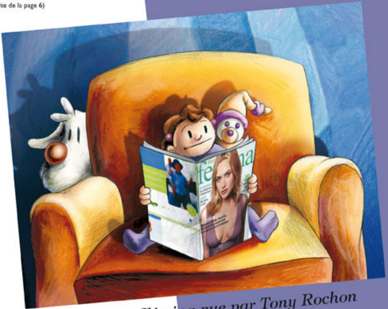
La lectrice Fémina vue par Tony Rochon